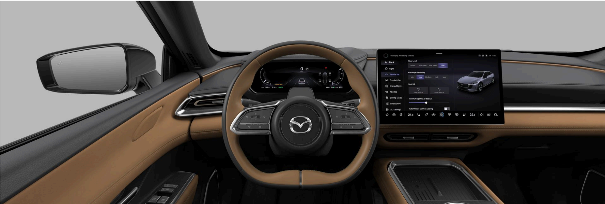
LACKIERUNG, FELGEN UND INTERIEUR