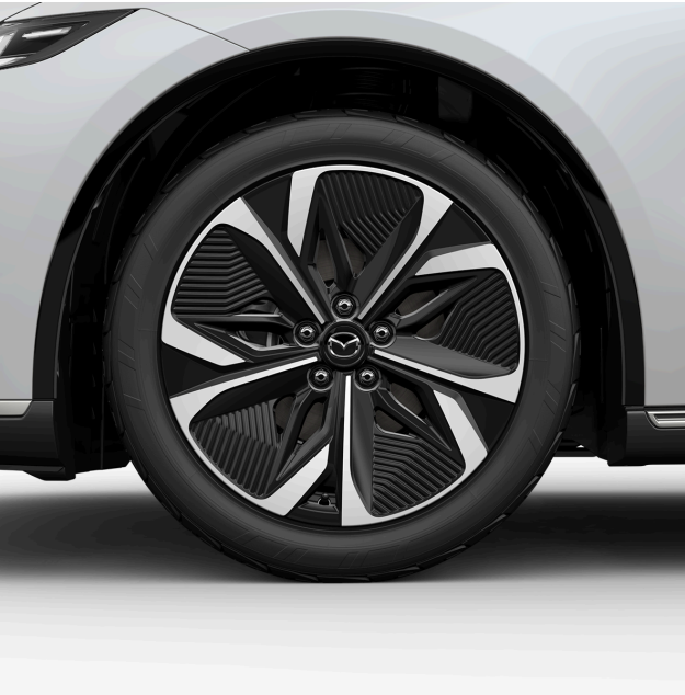
19-ZOLL-AERO-LEICHTMETALLFELGEN MIT 245/45 R19 BEREIFUNG