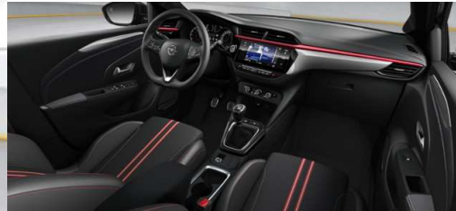
Corsa GS Line 1.2 Direct Injection, 74 kW (100 PS), Start/Stop, Euro 6d (Manuelles 6-Gang-Getriebe) Diamant Schwarz (Metallic), Stoff Banda, Schwarz