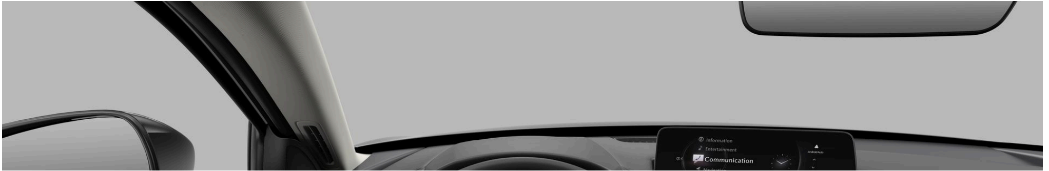
LACKIERUNG, FELGEN UND INTERIEUR