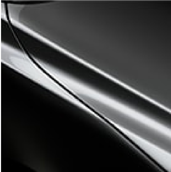
MACHINE GREY 850,00 € 1