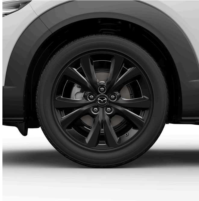
18-ZOLL-LEICHTMETALLFELGEN SCHWARZ Enthalten