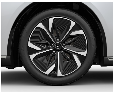
19-ZOLL-AERO- LEICHTMETALLFELGEN MIT 245/45 R19 BEREIFUNG