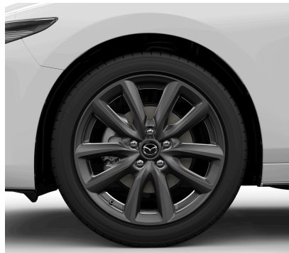
18-ZOLL- LEICHTMETALLFELGEN GRAU