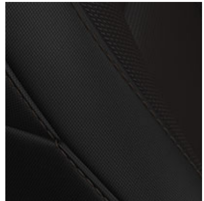
STOFF-SITZBEZUG SCHWARZ INKL. SITZHEIZUNG VORNE