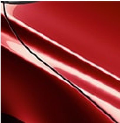
SOUL RED CRYSTAL