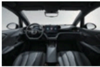
Schwarz und grau