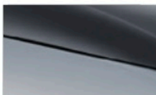
Skiing white + Urban grey