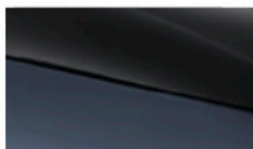
Atlantis grey + Jet black