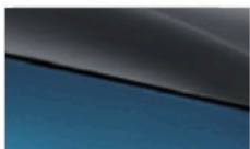
Surfing blue + Urban grey