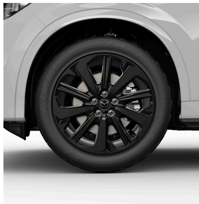
20-ZOLL-LEICHTMETALLFELGEN SCHWARZ MIT 235/50 R20 BEREIFUNG