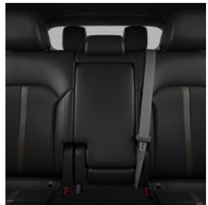
SITZBEZÜGE AUS NAPPALEDER IN SCHWARZ (7 SITZE) MIT SITZKLIMATISIERUNG VORNE UND SITZHEIZUNG VORNE UND 2. SITZREIHE AUSSEN