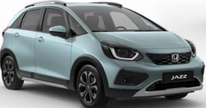
Fjord Mist Pearl