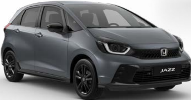
Urban Grey Pearl

Wir haben eine breite Palette an Farben kreiert, die perfekt zum stilvollen Jazz und zu Ihrem Lifestyle passen.