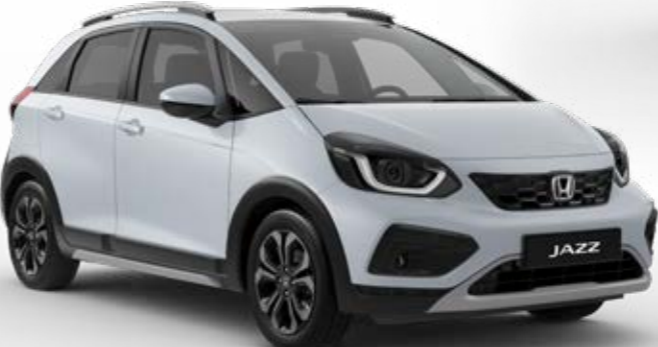
Premium Sunlight White Pearl