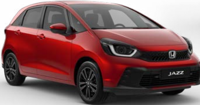
Premium Crystal Red Metallic