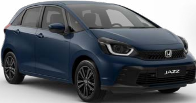
Seabed Blue Pearl