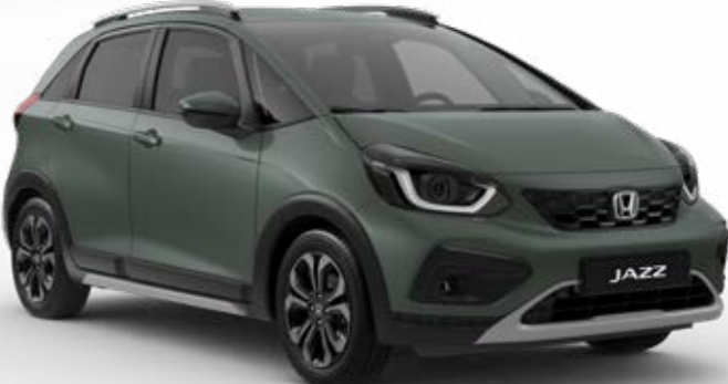
Sage Green Pearl