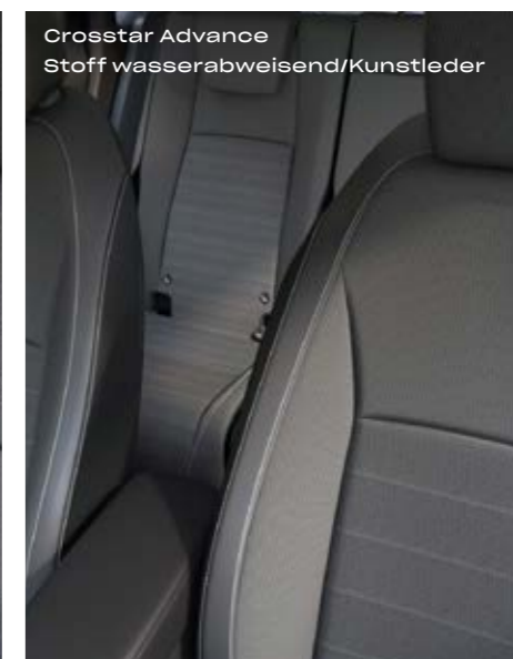
Crosstar Advance Stoff wasserabweisend/Kunstleder