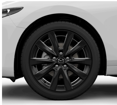
18-ZOLL- LEICHTMETALLFELGEN SCHWARZ