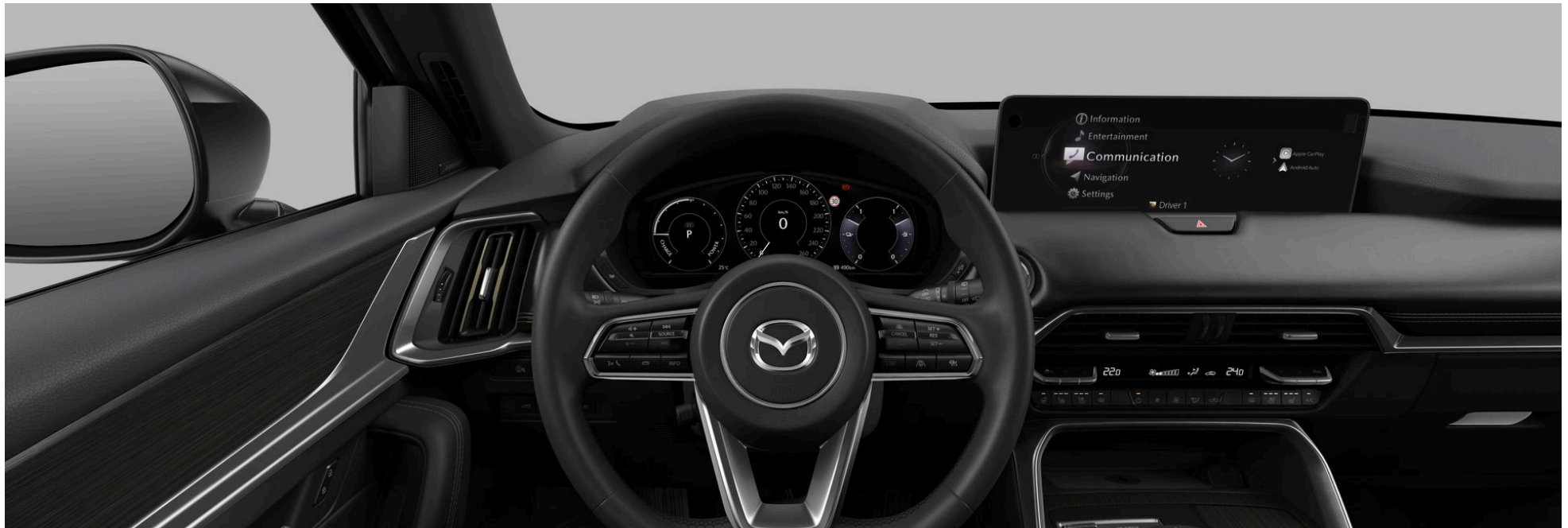
LACKIERUNG, FELGEN UND INTERIEUR