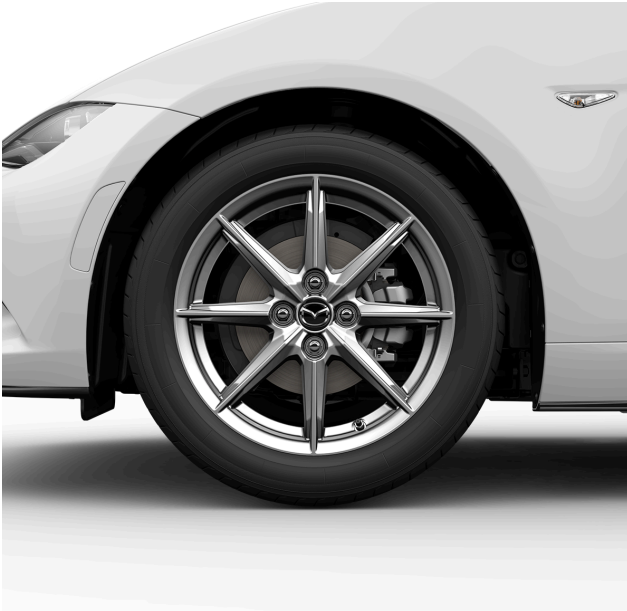
16-ZOLL-LEICHTMETALLFELGEN IN BRIGHT DARK, MIT 195/50 R16 BEREIFUNG