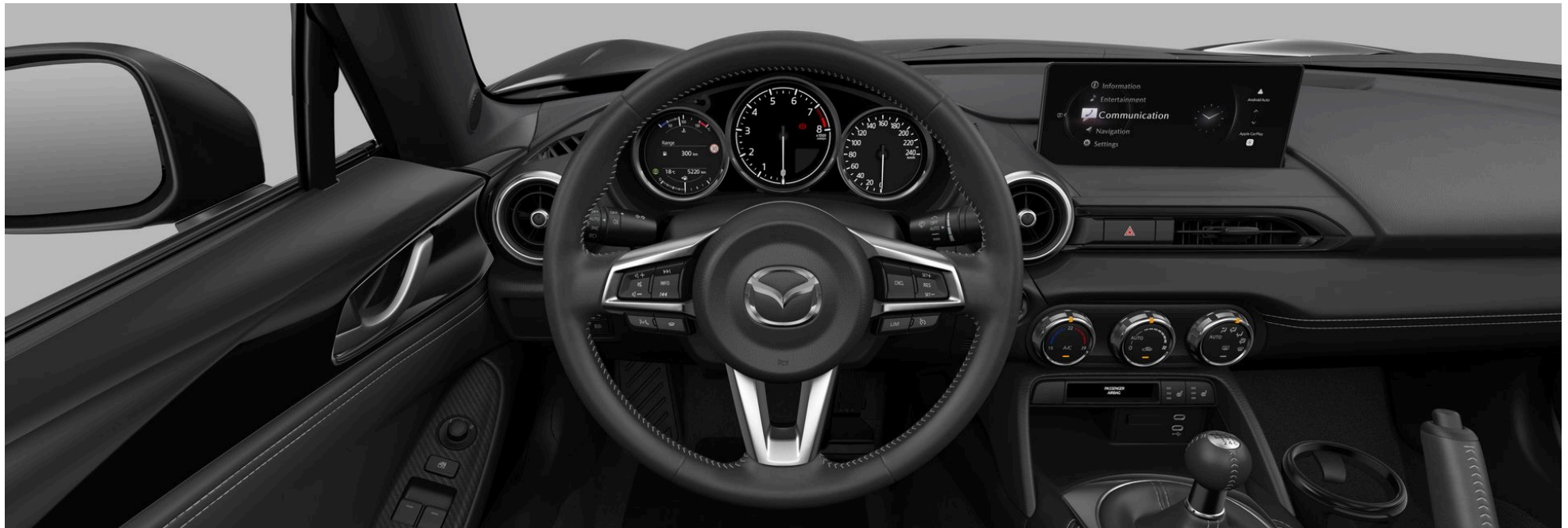
LACKIERUNG, FELGEN UND INTERIEUR