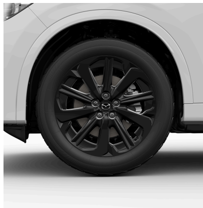
20-ZOLL-LEICHTMETALLFELGEN SCHWARZ MIT 235/50 R20 BEREIFUNG