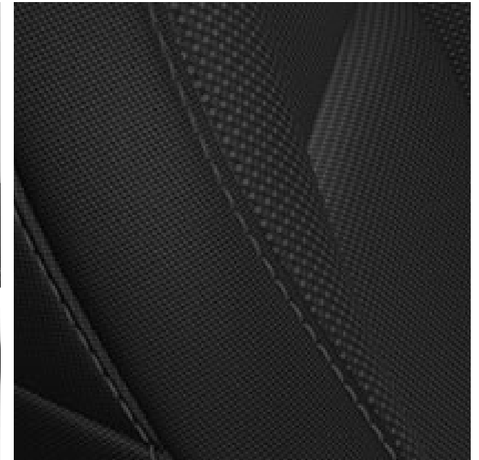
STOFF-SITZBEZUG DUNKELGRAU INKL. SITZHEIZUNG VORNE Enthalten