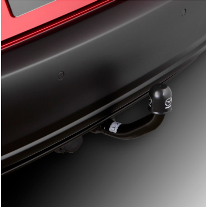
ANHÄNGEZUGVORRICHTUNG ABNEHMBAR (KIT)