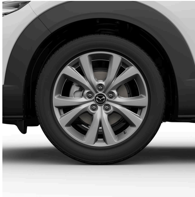
18-ZOLL-LEICHTMETALLFELGEN SILBER Enthalten