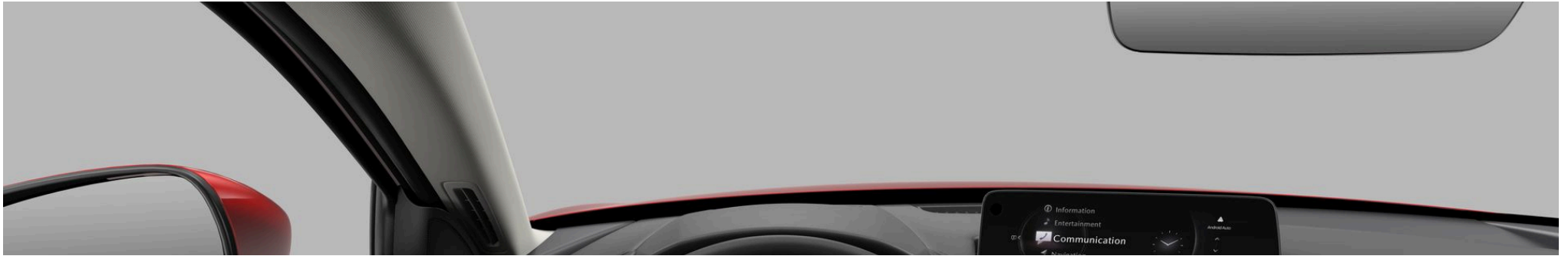
LACKIERUNG, FELGEN UND INTERIEUR